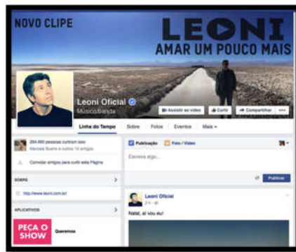
Fig. 2: Foto da página do artista Leoni no Facebook

No Facebook, em abril de 2011 a página de Leoni Oficial possuía 1977 pessoas e, em novembro de 2015, 264.661 pessoas 14 “curtem” a página e recebem atualização das postagens feitas pelo cantor ou por outros membros da página.