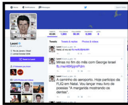
Fig. 3: Foto da página de Leoni no Twitter

vídeos e músicas. Assuntos que merecem mais reflexão também são tratados ali. Uso muito o Twitter e o Facebook para levar as pessoas para o meu site.” O que eu considero também muito inteligente utilizar de uma ferramenta como “transporte” para o seu site pessoal.