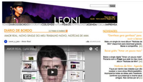
Fig. 5

Na aba home encontramos todas essas ferramentas descritas acima. O diário de bordo é uma espécie de micro-blog dentro do site. Na biografia encontramos a trajetória artística do cantor, desde o início de sua carreira. Na aba CDS/ DVDS o cantor disponibiliza para download gratuito faixas, singles, cifras das músicas de seus Cd's e Dvd's. Na aba fotos encontramos fotos do artista de shows, no camarim, durante a viagem, fotos que os fãs enviam para ele dos shows que foram assistir. Disponível apenas para a visualização. Na aba vídeos estão disponibilizados vídeos de shows, clipes, animações e até homenagem feita pelos fãs para o cantor. Na aba downloads o cantor disponibiliza além de singles, papel de parede, protetor de tela, e seu e-book “manual de sobrevivência no mundo digital”. Na aba agenda são oferecidas informações sobre data, local e horário dos shows. A aba fórum é um local de discussão entre os fãs e o artistas sobre os mais diversificados temas. Parte do site maior entrosamento entre os fãs e o artista. Na aba imprensa estão disponíveis release, fotos de divulgação e contato da assessoria de imprensa.