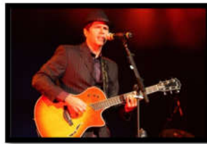
Fig. 1: Foto do cantor e compositor Leoni

Nesta pesquisa apresentamos como o cantor, compositor e escritor Leoni 7 utiliza dessas plataformas em seus trabalhos musicais, a fim de explorar o máximo de recursos tecnológicos a favor da sua performance, da sua divulgação como músico, da aproximação com os fãs, da vendagem de shows dentre outras possibilidades que a plataforma web oferece.