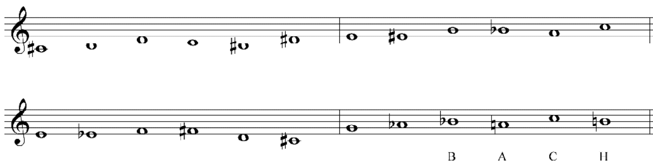
Ex.12. Duas séries da Paixão : a primeira série está baseada no hino Œwięty Boże e a segunda tem, no segundo hexacorde, o motivo BACH.

nas alturas de cada hexacorde, sendo que, na segunda série o Si natural, em vez de ocupar a nona posição, é a sua última nota (NEWMAN, 2002).